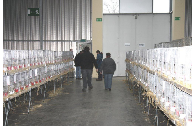
Die letzten vom Aufbauteam verlassen die Hallen.

Alle freuen sich auf die 21.Landesschau in Ulm. Die Käfige wurden großzügig aufgebaut. Es ist genügend Platz zwischen den Reihen. Züchterfreundlich kann zwischen den Reihen am Käfig über das Tier gesprochen und über die Bewertung diskutiert werden. Die Verkehrs- und Fluchtwege wurden mit den Verantwortlichen der Messeleitung abgestimmt. Sicherheit für Tier und Mensch hat oberste Priorität. Die Rassekaninchen sind artgerecht untergebracht und werden ordentlich mit Futter und Wasser versorgt. Interessante Anbieter aus dem Futterbereich sowie vom Zubehörhandels sind vor Ort. Hier kann sich jeder noch für die nächste Zuchtsaison versorgen.