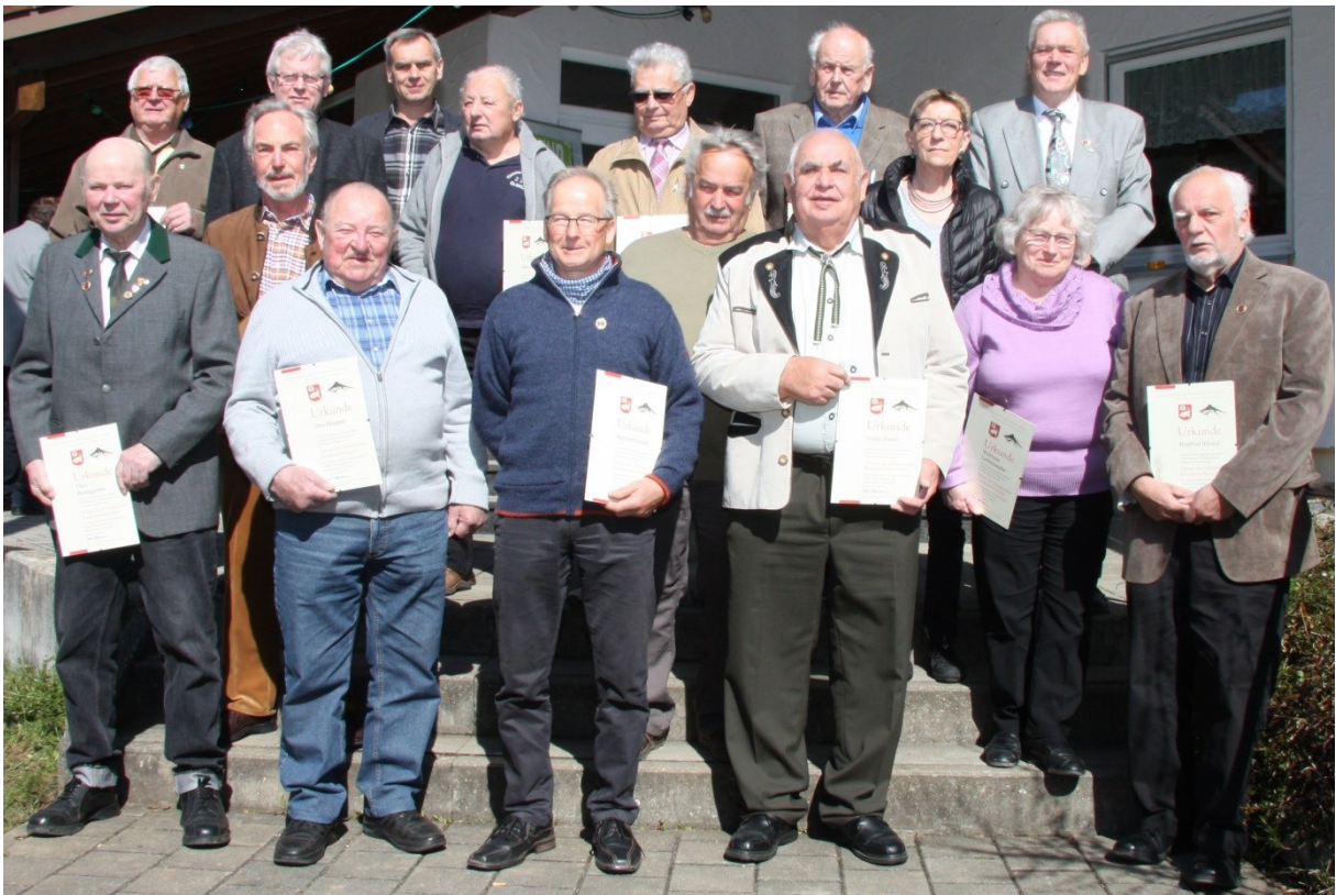
Meister der Schwäbischen Rassekaninchenzucht